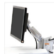
BRACCIO PER LCD