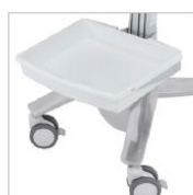
RIPIANO FRONTALE SV