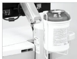
PORTA-SALVIETTE PER T SLOT