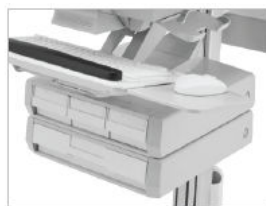
4 CASSETTI (1 PRIMARIO TRIPLO E 1 SUPPLEMENTARE SINGOLO)