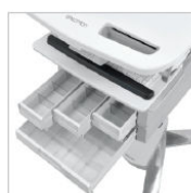
VARIE CONFIGURAZIONI CASSETTI