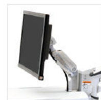
BRACCIO PER LCD