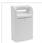
SISTEMA DI ALIMENTAZIONE LIFEKINNEX*

Ulteriori accessori disponibili sul nostro sito www.quartex.it/medicale/